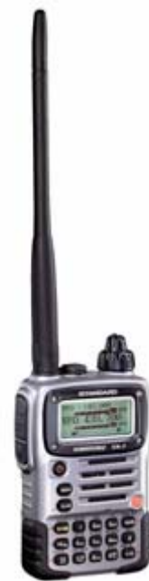
ハンディー トランシーバー

アマチュア無線は携帯電話のように基地局を経由しないで、相手同士直接電波が届いてはじめて交信が成立します。ここが携帯電話と異なるところです。また電波は広範囲に伝わるので不特定多数の人と交信が可能です。 知らない人と話して何が楽しいの？と思われる方も多いと思いますが、これをゲームにしちゃえ！ というのが後から述べる「コンテスト」です。アマチュア無線にはコンテスト以外にもいろいろ楽しみがあります。たとえば海外の人と交信して、どこどここの国と交信できた！これで200カ国と交信できた、と国の数を増やして楽しむ人や（なぜ地球の裏まで電波が飛んでいくのかは付録で説明します）、日本国内で言えば、どこどこ市と交信できた！目標は日本全国にある600以上の市と交信すること、と目標を決めて楽しんでいる人も大勢います。このように 国、市、郡、区などの数や交信した相手の数などにより賞状をもらうことができます 。他には、電波を月に向けて発射して、反射波によって遠くの人と交信するマニアな人、無線機にパソコンをつないでデジタル通信をする人、モールス符号で交信する人、電子工作が好きでいろいろ作って無線機につないで遊ぶ人等等など・・・これ以外にも数え切れないくらいの遊び方があります。私たちアマチュア無線クラブでは「コンテスト」を中心に活動していますが、 こんなことやりたい！ という気持ちがあればなんでも挑戦できるのがアマチュア無線の魅力ですね。一生かけても遊びきれない魅力が詰まっています。